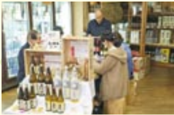
ワインってわからないモノ?第3弾 (南宮幸酒店)