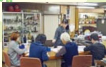
気持ちが伝わるラッピング(みさ伝 本店)