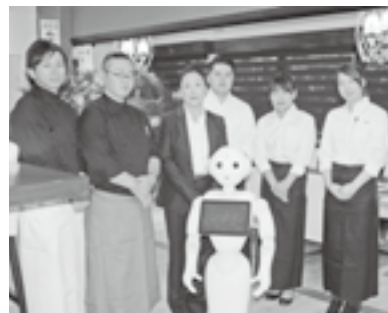
ロボットのペッパー君

央にはオープンキッチンがあり対面式になっているのでカウンターに座るとシェフが料理を作る所を見ながら食事ができます。収容人数は60名ほどで、テーブル席やボックス席、カウンター席があります。場所は十日町駅から徒歩3分程の場所にあるので電車利用の際もとても便利です。 メニューは、国産牛を使ったサーロインステーキ、石焼ステーキ、妻有ポークの肩ロース、大山どりのモモ肉や骨付き肉のスペアリブなどいろいろなお料理があり備長炭と薪で焼き上げます。石焼ステーキは、熱々のプレートで出てくるので好みの加減で食べるができます。 又、「お肉がちよっと苦手」という方には、魚介類を使ったお料理や前菜、サラダ、パスタなどのメニューも豊富にあります。いろいろな種類の物を食べたいという方には、「おまかせ前菜盛り合わせ」がおすすめです。