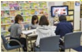
東京ディズニーシー攻略法(共立観光株)