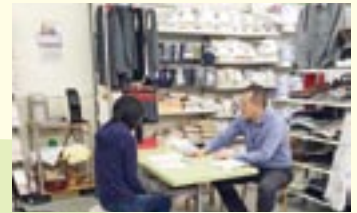
あなたにぴったりの枕選びをお教えます (総合衣料ヤナシヨウ)

11月1日(日)～11月30日(月)の期間、得する街の ゼミナール「とおかまちゼミ」が開催されました。 ご参加くださいました皆様、ありがとうございました。