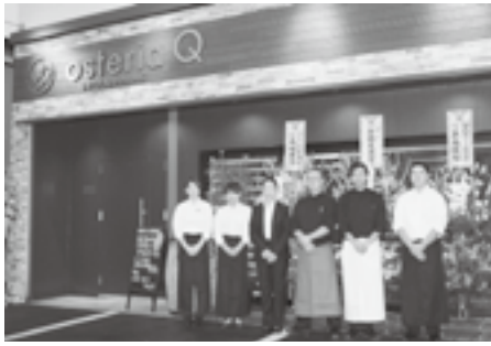
柳マネージャーとスタッフの皆さん