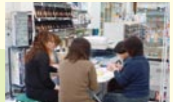
折り紙で簡単かわいいBOX作り (中央印刷山内商店)