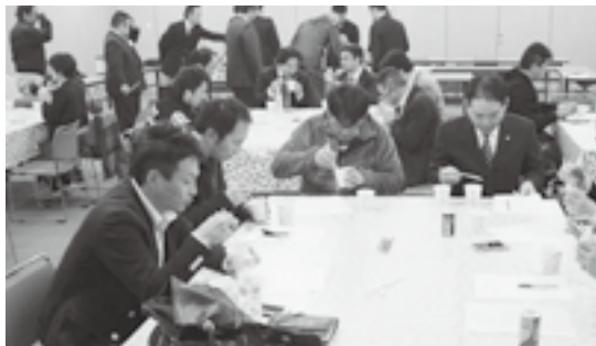
メニュー試食の様様

地域のPRを目標に、当プロジェクトが取り組んでいる地元食材を用いたオリジナルフードメニュー開発の一環として、来年一月に新発田で開催される城下町しばた全国雑煮合戦への参加メニューを検討するため、メニューの試作と試食を行いました。メンバーから出された意見を集約して、本番に向けて取り組んでいきたいと思います。