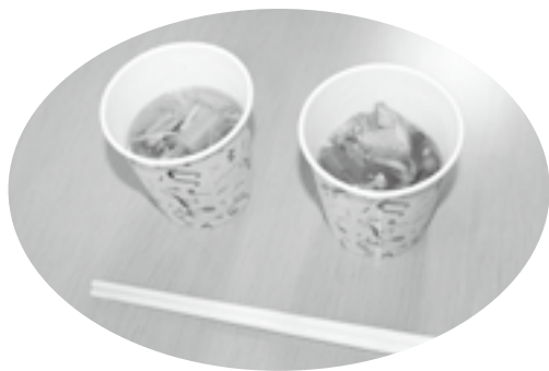
試作メニュー試食の2品

今回の担当例会は「地元食材の可能性について考える」と題して開催しました。地元飲食業関連事業者の活性化と十日町地