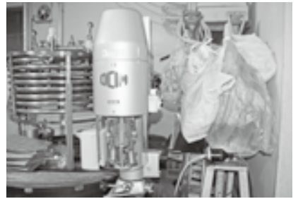
海外製の機械が出番待ち

十日町のPRのため30年前から続くシリーズです。 酒蔵はピーク時の昭和48年には全国で三千事業所ありましたが、現在は約半数にまで、生産量も九七二万石から三四〇万石に減少しています。そのほか、若い世代を中心にアルコール消費量が減少していることに加え、十日町だけでなく首都圏においても、お酒を提供する飲食店が廃業等により減少している状況があります。