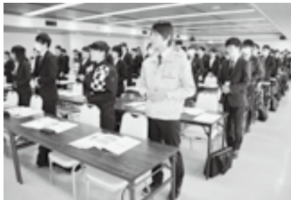
立ち居振る舞いなどビジネスマナーの基礎を学びました