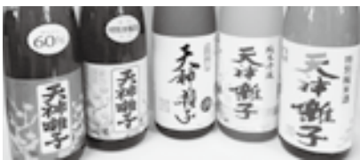
魚沼酒造の各種銘柄