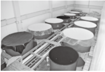
大きなタンクは圧巻

更に「縄文」シリーズの「縄文の響」「縄文の恋人」「縄文の焔」も中条地区の発展のため、