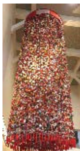
幸せ呼ぶ傘吊るし囃