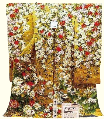
2017年ユーザー審査グランプリ 振袖 伊藤若冲【牡丹小禽図】 (樹)青柳