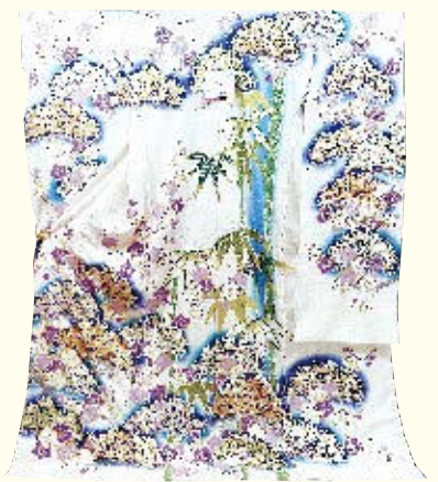
2017年経済産業大臣賞 特選手描振袖 松竹梅・青の煌めき 吉澤織物(株)