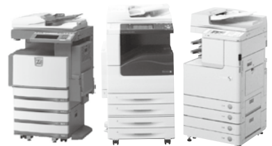
TOSHIBA FUJI XEROX Canon

オフィスのベストパートナー (株)滝沢印刷 十日町市本町2丁目 文具館タキザワ TEL(025)757-2191