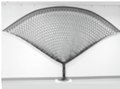
1枚布で作成した「生命の樹」

ます。民間福祉事業所と連携した24時間体制での見守りや専門家による生活相談、健康相談も受けてくれます。なんといっても中心商店街のなかに位置し、アーケード沿いに歩いて買い物に行けることが魅力です。他にも有料サービスとして、食事の提供、トランクルームやコインランドリー、地下駐車場等も利用できます。大変気になる料金ですが、1Kで6万9千円、高齢者向けサービス料金は別途1万円となっております。