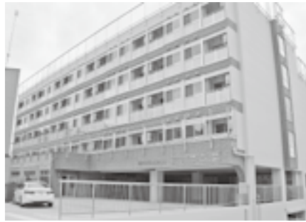
5階建てのアップルとおかまち

住所：十日町市本町2丁目4-1 電話：755-5575 FAX：755-5573 営業時間：9時～17時