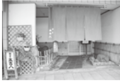
若草色の暖簾が目を引く入口

住所：十日町市本町5丁目 電話：752-2858 定休日：不定休 営業時間：昼11:30~14:00 夜17:00~22:00 ※昼・夜共要予約