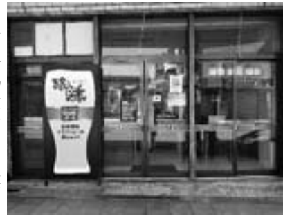
ビールの看板が目を引くお店の外観

二〇一九年八月に創業、翌年四月に現在の店舗を構えました。もともと香りのあるビールに興味があり、創業前には本場アメリカへ一週間ほどビール合宿にも行かれたそうです。