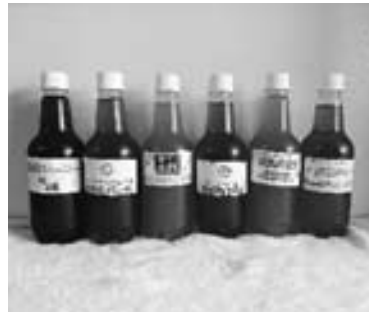
一番人気は「ジョークンIPA」(左から3つ目)

ルーツを使った珍しいビールもご用意しています。コーヒータンビールは、ケーキなどのスイーツとも合うとのことですから驚きです。