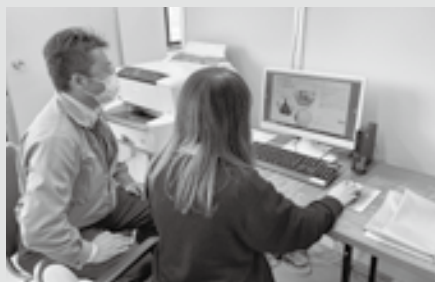
チームで役割分担し、Instagram 投稿!!

セミナーを受講するきっかけは、SNSを活用した取組を始めようとした矢先にちょうどセミナーの案内があったところからでした。SNSの中でも主にInstagramの取組を進めており、社員の採用にSNSを活用したいとのことで、セミナーを受講いただきました。ホームページはすでに作成済みでしたが、新たにInstagramというSNSを活用することによって、どのような会社であるか写真等を使うことによってわかりやすく表現することができるようになります。セミナーでは簡単な写真の加工の仕方や画像編集アプリの使い方などを教えていただいたので、投稿に利用できる画像編集アプリを用いて投稿しているとのことでした。現在では約70投稿まで増えてきており、100投稿を目指して更新を頑張っているとのことでした。そして更新はSNS担当として負担がかからないように少人数でのチーム編成をしており、役割分担をして更新に励んでいます。結果としてフォロワー数が増えてきているとのことでした。