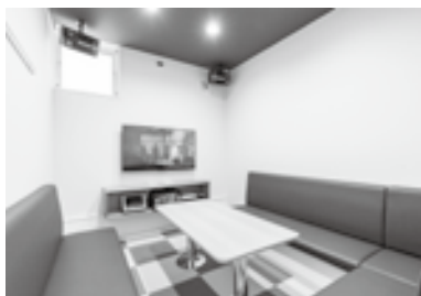
落ち着いた雰囲気のカラオケルーム

です。また、内装も部屋によって、それぞれの木からイメージした作りになっていて、木材の香りを感じる落ち着いた空間になっています。カラオケにはテレビ番組でも使われる精密な採点機能も備わっているため、スポーツ感覚で歌の練習にぜひ活用して欲しいとのこと。将来的には、歌の大会など開催し十日町から歌うまの原石を発掘できればいいなおっしゃっていました。