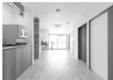
明るい雰囲気の店内

カラオケの部屋は全部で8つ。それぞれ木の名前が付いたお部屋になっており、カラオケの機器を収納している棚は、実際にその木材で作ったものになっているそう