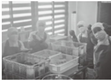
加工所での作業も楽しそうです

品にしていて、女性でも無理なく扱える重さになっています。加えてウーファでは一般的な取引よりも高い金額でサツマイモを買い取っています。自分たちの事業だからこそ、こうした規格も自分たちで決められるそうです。そしてなぜウーファで生産する農産物はサツマイモなのか、ということにはいくつもの理由がありました。まず魚沼産コシヒカリが育つ十日町で育てた農産物はとても雑味が少なく濃厚な味わいになるそうですが、特にサツマイモは加える肥料で味が変わるものではなく、土壌の良さが味に強く反映される作物だそうです。そして雪国であることで害虫が越冬せず、無農薬栽培に挑戦しやすい上に、湿気の多い冬もサツマイモの追熟にとても適している、バイヤーからも「甘いだけのイモはたくさんあるけれど、こんなにイモの味がするイモはここぐらい」と太鼓判を押されています。 他の園芸作物などは毎日収穫の必要があるそうですが、サツマイモに必要な農作業は時間の融通が効き、子育てをしている女性でも仕事と家庭の両立がし