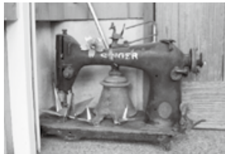
ご両親のミシンに手を加えてオブジェに

員としても精力的に活動され、市政に貢献されていました。そんなお父様に若いころは反発することもあったそうですが、今では作業着を始め、そこかしこにお父様のスーツの色を思わせる紺色をイメージカラーに使い、名刺の裏面にもしっかりとりのロゴが受け継がれています。