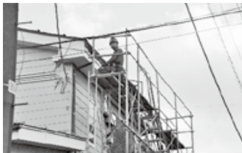
高所での作業の様子

です。将来は地域の方に愛され、地元で根付いた会社になりたいという思いで、日頃からお客様に対してわかりやすく丁寧な説明、きれいな仕事を心がけていると言います。「きれいな仕事をしてお客様に喜んでいただけたときが、一番励みになります」とおっしゃいます。「業界最年少での独立なので信用、信頼される会社になれるよう頑張りたいと思っています」と言い、組合への加入などにも前向きで、同業の事業主の方の背中から多くのことを学びたいとの意欲を感じました。