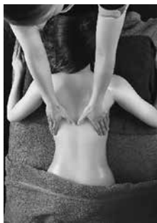
リンパマッサージ

綺麗になりたい方はもちろん、お身体に不調を感じる方も是非一度ご利用になってみてはいかがでしょう。脱毛体験3,000円〜その他メニュー体験も半額からあります。