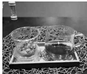
自慢のハーブティ

ーブティです。飲んでみると豊かな香りと優しい甘みがあります。「お砂糖を使用せず植物の甘みなんですよ」