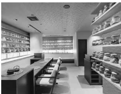
メディカルハーブの瓶がお出迎え

ーブを取り扱っているエステサロン」だぞつです。メディカルハーブとは、植物をそのまま乾燥させ健康維持のために使う「薬草」「香草」のこと。植物から出るエネルギーに着目し、現在約200種類のハーブを取り扱っています。