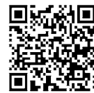
日本政策金融公庫 特別相談窓口