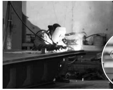
手作業の溶接による細かなマスコット

「若いうちは親の言うとおり」に家業を継ぐことが嫌でした。と、反発から様々な職業を経験しましたが、将来のことを考えるうちに24歳で家業を継ぐことを決意し、7年前には代表取締役に就任しました。