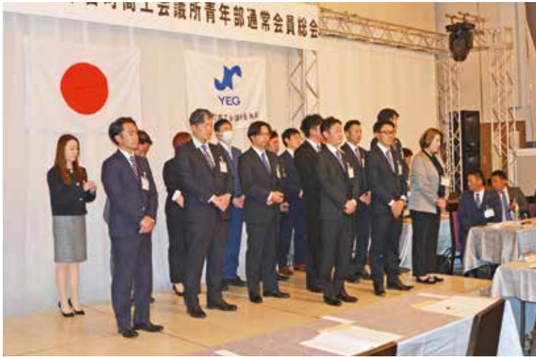
新入会員メンバー