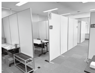
* 能登事業者支援センター

被災された皆様の一日も早い復旧を願うとともに、今後もできる限りの支援を当所としても行ってきたいと考えております。