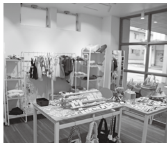
かわいい商品が並ぶセレクトショップ

に受付と小物やアクセサリなどを販売するセレクトショップ、2階が写真撮影のスタジオとなっております。