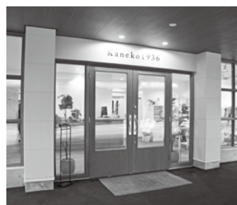
新しく生まれ変わった写真館