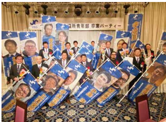
令和5年度卒業メンバー