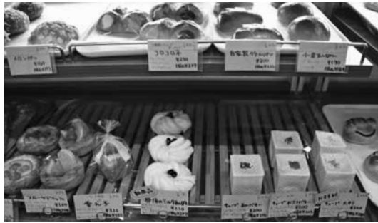
魅力的なパンが並ぶ店内

まいもとバターを包み焼き上げた「おさつバター」をはじめ、「カフェモカ」「あんバター」、ホタテ丸々一個とホワイトソースを包んだ「ホタテ」の計4種類のバリエーションを楽しめる商品です。